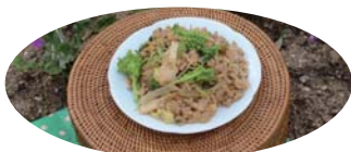
管理栄養士 稲葉 恵