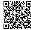
詳しくはQRコードを読み込んでね。

ポニーふれあいイベントを毎月1回、開催しています♪ 11月開催日→2018年11月4日(日)/12月開催日→2018年12月9日(日) 詳しくは鶴見緑地乗馬苑までお問合せいただくか、QRコードよりご確認ください。