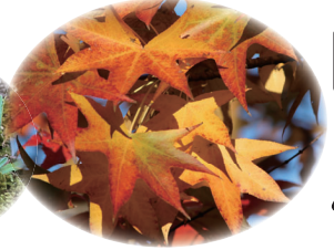
モミジバフウの実