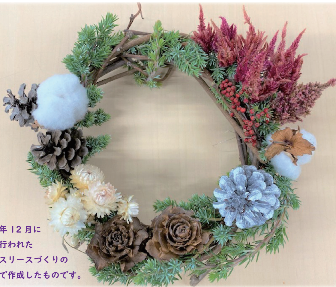
写真は昨年12月に 鶴見緑地行われた クリスマスリースづくりの イベントで作成したものです。