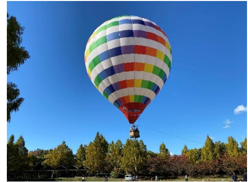
熱気球係留フライト体験