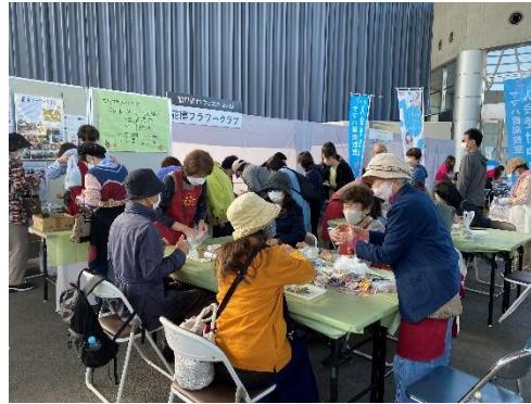
寄せ植えワークショップ