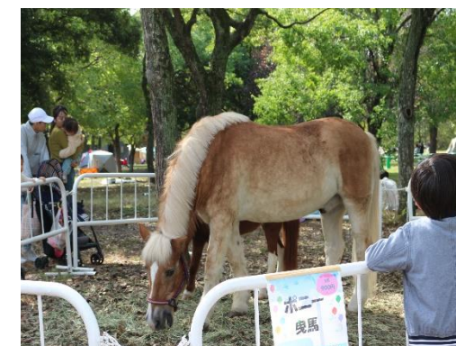
ポニーのふれあい