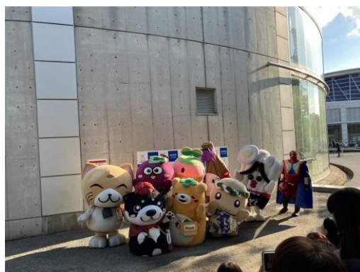
ご当地キャラクター