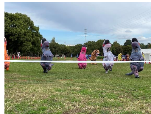
ティラノサウルスレース