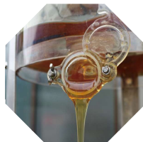
遠心分離機で採蜜